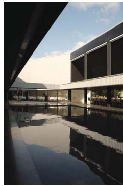
Liverani/Molteni Rain-Hail Phuket