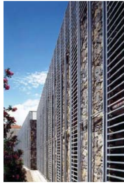
mag.MA architetture di facciata