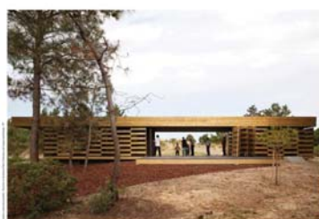
PARATELIER Padiglione Parco Aventura