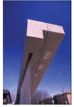
Zanirato Studio Riquilificazione urbana