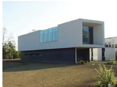
nEmoGruppo Architetti Showroom e Uffici