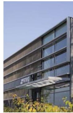
lotti Pavarani Showroom Smeg