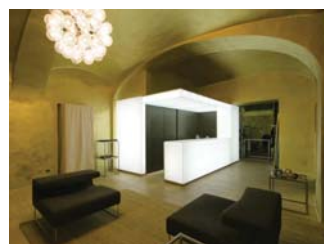
STUDIO 74 Before Jeans N Dress