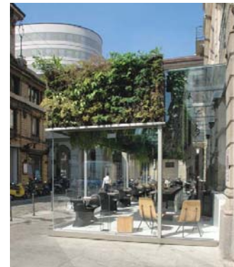
Nicolino & Ratti Ristorante Trussardi alla Scala