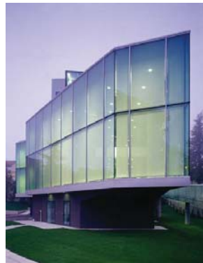
Lorenzo Rossi Ristorante Indesit