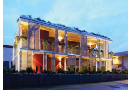
Designo srl Easy Building System