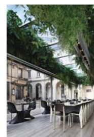
Nicolino & Ratti _ Ristorante Trussardi