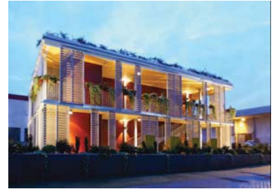
Designo srl _ Easy Building System