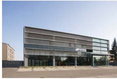
Iotti Pavarani _ Showroom Smeg