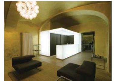
STUDIO 74 _ Before Jeans N Dress

Immagini in alta risoluzione presenti su: